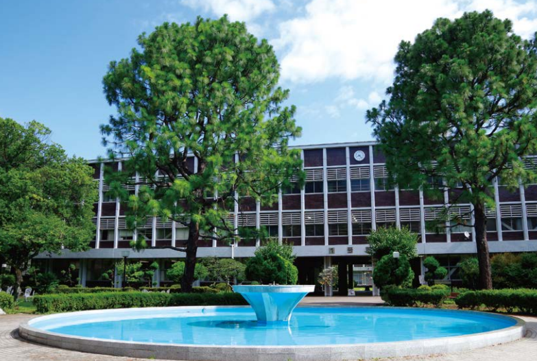
Musashino Campus 武蔵野キャンパス