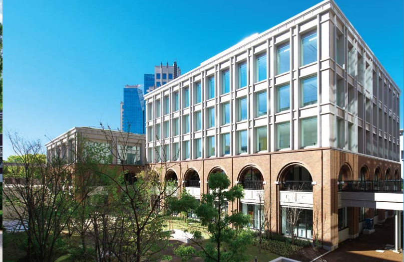
Ariake Campus 有明キャンパス