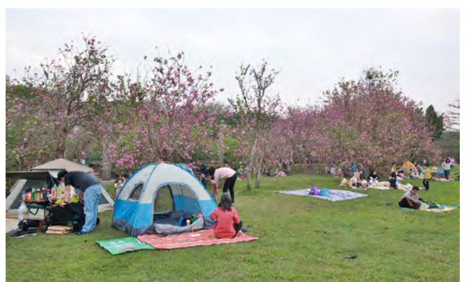
▲民眾於草地上休憩，體驗樂活