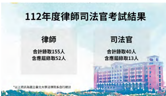
▲ 112 年度律師司法官考試結果

政、財經等部門菁英，培育國家法律人才推動之搖籃，不管是在國家考試，抑或是研究所入學考試，學生參與各項考試，高錄取率為國內各大學法律系所有目共睹。院系宗旨為培育「具法律專業核心能力與社會關懷之優質法律人」，在校師生及畢業校友均為法律界之中流砥柱，培育無數社會中堅份子為國家與社會服務，影響力深遠。長期以來，法律學院校友會也積極支持，成為法律學院師生的重要後盾。