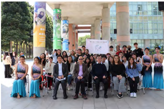
▲僑外生週開幕典禮合影

國際事務處與僑外陸生聯誼會、馬來西亞同學會、緬甸同學會、印尼同學會、海外同學會及港澳同學會，於 3 月 17 日及 21-22 日合作辦理 112 學年度