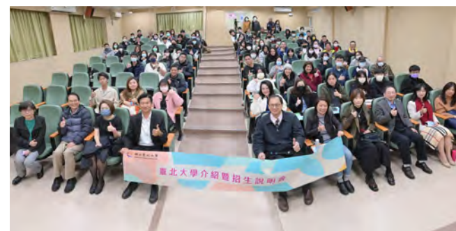
▲本校師長與學生、家長於說明會合影

現場提問階段更是絡繹不絕，許多同學及家長皆提出了各種不同的問題，例如報考方式、報名資格、入學相關規定等，各系主任及進修部業務同仁皆詳盡的回覆每個問題，讓有意報名者能更明瞭各項報考規定及方式。