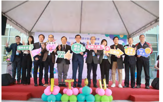
▲與會主管及貴賓合影

今年就博會廠商報名情形熱烈，可看出臺北大學畢業生的素質受到業界信賴。為使學生順利銜接職場，學務處職涯發展中心三月起辦理多場職涯午間講座，包括履歷撰寫、面試法則、簡報技巧、職場服儀等主題為求職活動暖身，相信可以協助學生順利邁向從學校到職場的最後一哩路。