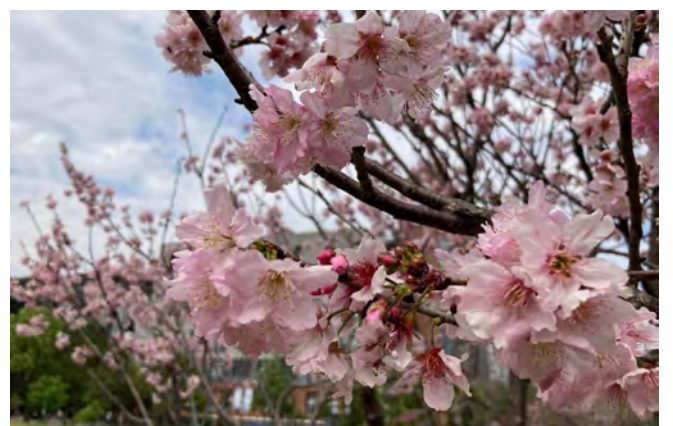
▲臺北大學櫻花綻放