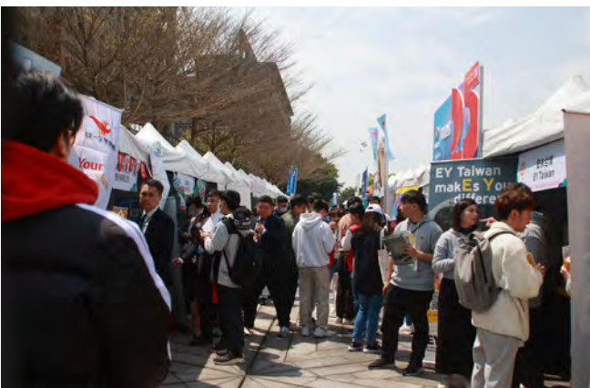
▲就博會吸引許多同學參加

今年就博會主題為「飛鳶翱翔 職奔未來」，活動規模更甚以往，共計 84 家企業及機關入校設攤徵才，提供四千多個職缺，開出起薪平均近 40 K 搶人才，其中起薪最高達 55 K，各企業求才若渴，皆積極報名入校徵才。學校力求產業多面向及職缺多元化，貼近產業脈動，以期符合各學系學生求職需求。