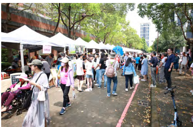
▲活動吸引超過上千名民眾參加