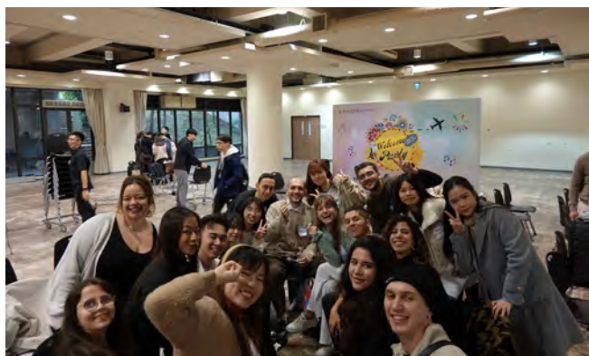
▲外國學生與國際學伴相聚一堂