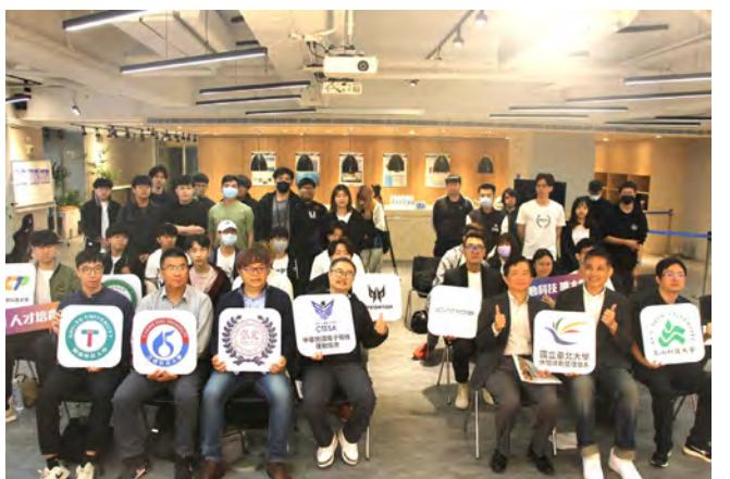
▲開幕式貴賓與選手合影

接著，與協會和國內業者研擬設計相關教材，並在合作學校開設培訓體驗課程，進而檢驗成果。本計畫已成功為我國數位虛擬運動人才培育奠定基礎知識體系。