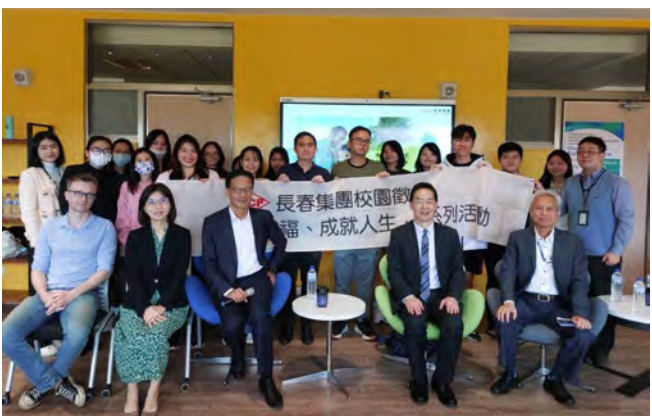
▲長春集團來賓與國際學院師生合影

長春集團於 3 月 5 日與永續創新國際學院和城市治理英語碩士學位學程，攜手舉辦首場「招募海外優秀人才說明會」，旨在媒合永續創新國際學院的優秀外籍生與臺商對國際人才的迫切需求。這場活動吸引全院來自不同國籍的學生參與，認識長春集團的發展與人才需求。