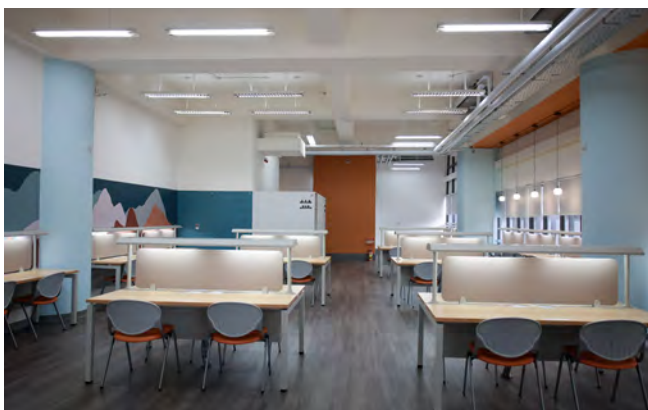
▲歐臥室為圖書館第三間所屬自習室