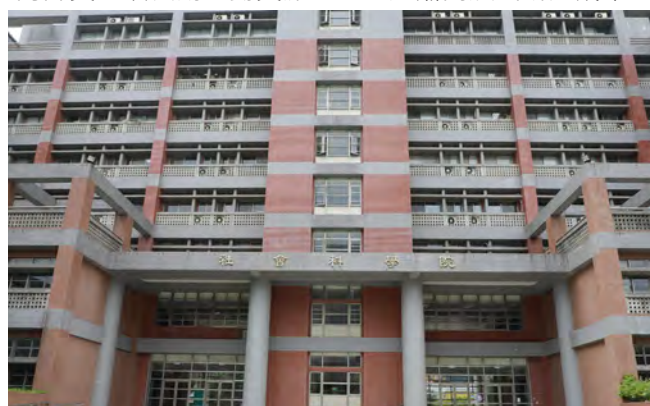
▲社科院成立院級「高齡與社區研究中心」

研究中心也獲得「台灣超現代公民行動聯盟」承諾育成 3 年，每年預計捐贈 100 萬元經費，而研究中心也將成為校內高齡跨領域之平臺，除社科院師資外，也將邀請各院相關師資加入，讓校內高齡與社區研究的師資可以長期互動交流，並且逐漸開展出研究成果。