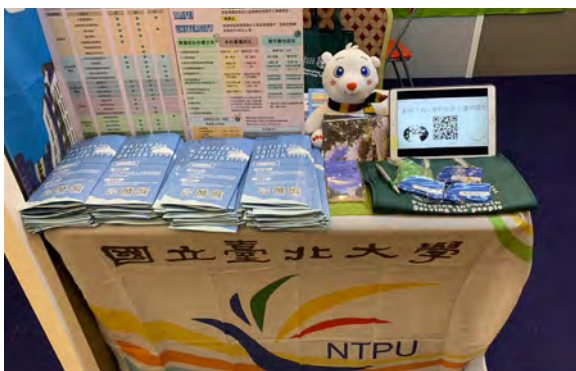
▲馬來西亞教育展臺北大學攤位

4 月 3 日至 4 月 4 日在峇株巴轄成功舉辦第一場教育展，吸引超過 4,000 名學生前來參觀。學生對於本校商學院展現出高度興趣，人文及法學院次之，而民藝所、犯研所、休運系等特色系