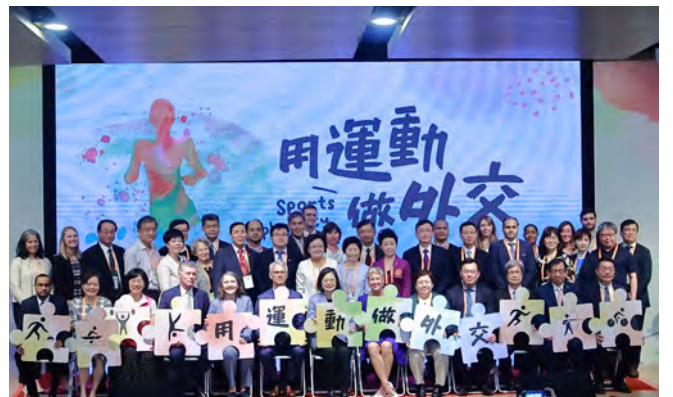
▲總統與北聯大四校來賓於臺上合影