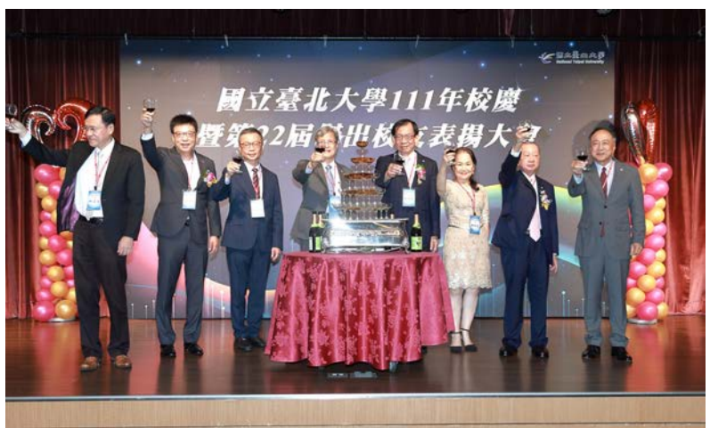
▲慶祝臺北大學創校73週年