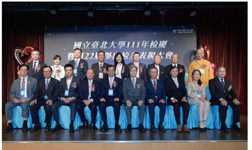
▲第22屆傑出校友與貴賓合影留念

組成，會中邀請各推薦單位派員列席說明推薦理由，讓遴選委員瞭解被推薦人相關事蹟，以昭慎重。