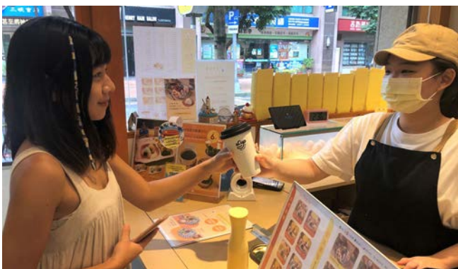
▲ 本次循環杯體驗活動於三峽北大特區展開

環保局表示，據環保署統計，全臺每年約使用40億個一次性飲料杯，回收處理必須承擔大量的成本，