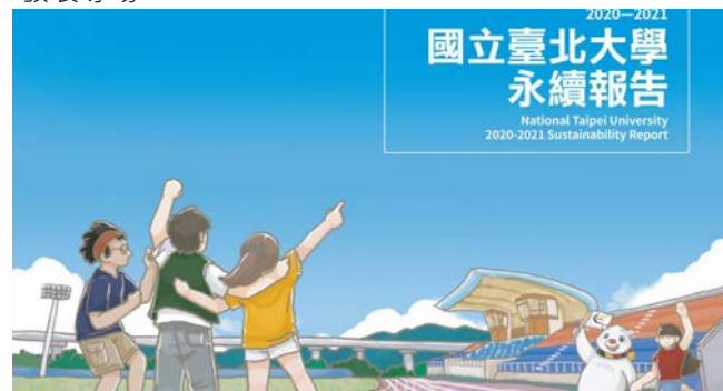
▲ 2020-2021 永續報告

「2022TCSA台灣企業永續獎」定11月16日在臺北圓山大飯店公開頒獎，頒獎典禮同時還將舉辦2022全球企業永續論壇(Global Corporate Sustainability Forum, GCSF)，商學院也將於論壇中承辦學術論文發表專場。