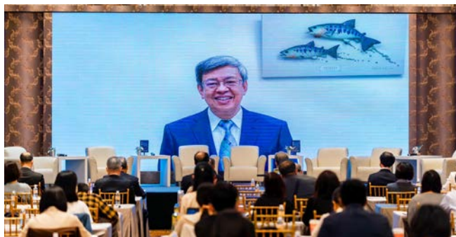
▲前副總統陳建仁預錄視訊致詞

榜單是由美國史丹佛大學的專家團隊，透過引文摘要資料庫 Scopus 論文影響力更新至2021年底的數據計算出，分為22個領域和176個子領域，所使用的關鍵指標包括：「總引用次數」、「Hirsch h-index」、「共同作者修正的 Schreiber Hm-index」、「單獨作者」、「單獨或者第一作者」、「單獨、第一或者最後作者的文章引用次數」等六項。