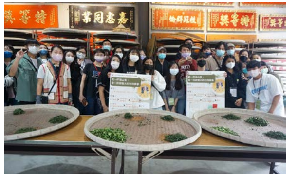
▲參與活動的學生們學習揉茶技巧

三峽地貌涵蓋平原、丘陵與山區，其中丘陵與淺山地區一帶，成為泰雅族大豹社活動的範圍，也是早期先民移入墾植時聚集的茶產區。數百年來，原漢族群走過清、日、民國不同的治理型態，在地方社會史、政治史和經濟史展現出多元樣貌，讓三峽充滿濃濃的地方人文特色。臺北大學力行大學社會責任計畫，深化海山鏈結，期許為在地文創發展，找出更多活水。