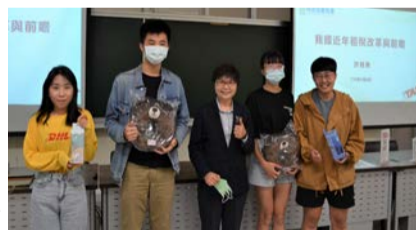
▲許慈美學姐與課堂問答得獎同學合影