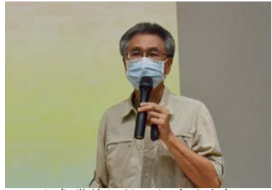
▲臺灣蕨類教父郭城孟老師

「全世界只有臺灣人吃破布子」，從許多大家習以為常的事物和生活方式出發，有「臺灣蕨類教父」之稱的臺大退休教授郭城孟鼓勵所有師生，從環境變遷的角度，可以看見臺灣在全世界人文發展和生態上特別的角色，不要小看自己所在的土地，換個眼光面對生活，視野就會很不一樣。