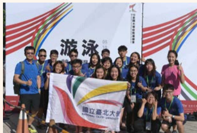
▲游泳代表隊於大運會合影