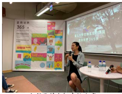
▲邱于芸老師來校分享

曾任文化部政務次長及台灣土地開發有限公司總經理、並於臺北科技大學及政治大學授課的「卡士達創業加油站」創辦人邱于芸老師於4月28日來校分享，由林文一國際長、僑陸組傅健豪組長共同接待，於圖書館2樓思巢進行「走向世界365天，旅程的自我對話與思辨」交換生培力系列講座演說。