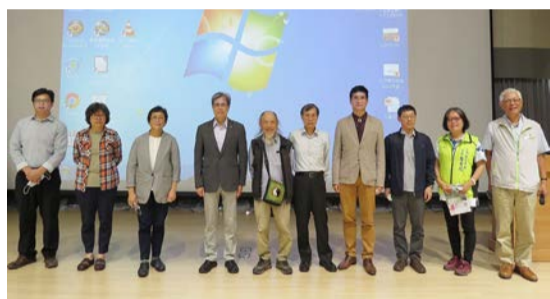
▲低碳與藻礁論壇邀請各方人士同場對話

藻礁生態保育與中油第三天然氣接收(港)站(三接)開發爭議,即將在八月訴諸公投。公共事務學院自然資源與環境管理研究所5月1日舉辦公民論壇,邀請各方意見相互表述,提供更多角度思考方向。多位學者主張,生態保育策略多元,友善開發也有復育機會,然而也有民眾認為,除了人類對話也應尊重不會說話生物的權益,避免僅滿足人類而犧牲其他物種。