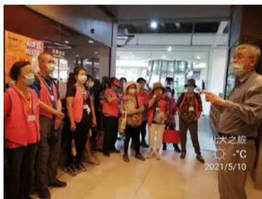
▲ 圖書館馬祖瑞組長帶領中心成員導覽

山學文史與校史館，一起欣賞往日校園情景與在地文史。其中一名照顧者也分享道「丈夫曾經是台北大學老師退休，在台北校區任教，是企管系兼任老師，加上遷校三峽，這次有機會來北大參觀，真的覺得環境很不錯！」。