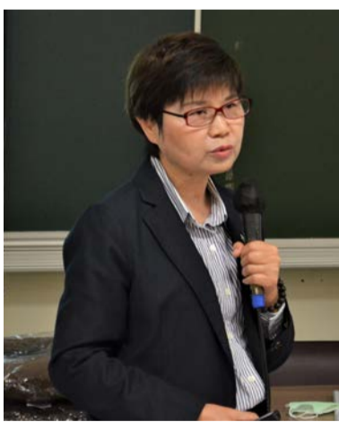
▲許慈美學姐分享職涯歷程

5月6日，財政部賦稅署署長許慈美（財稅學系67年畢業、行政學系碩士班92年畢業、第18屆傑出校友）特地返校擔任「創新創業大講堂」課程講座。從基層稅務員到今日的賦稅署署長，學姐擁有「營業稅活字典」、「電子發票之母」、「境外電商稅制之母」等美譽。面對這些成就，她特別提點台下同學「要做自己的