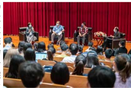
▲翻譯實務座談會盛況

最後，針對人工智慧與高科技對於譯者與編譯所帶來的挑戰，三位編譯一致認為機器翻譯確實有進步，但還沒有達到可以完全取代翻譯人員的程度，特別是隱喻和弦外之音等，都仍需要人的參與與投入才能更精確地翻譯並呈現。