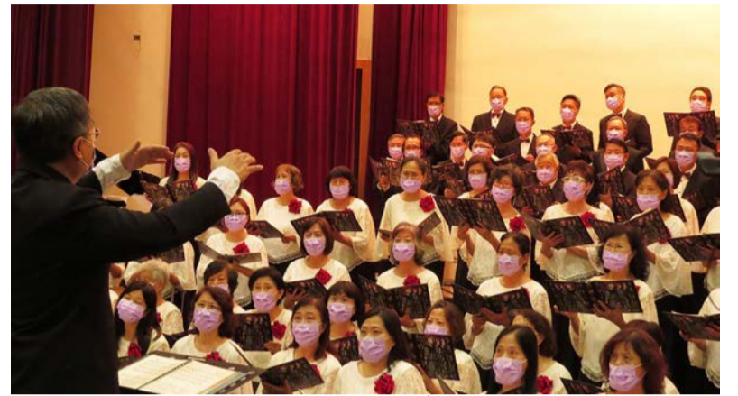
▲宇宙光百人大合唱

應歷史系、教職員信望愛團契邀請，「宇宙光百人大合唱」5月8日下午在商學院國際會議廳舉辦「疫情亦情」音樂會，超過三百多位師生和社區民眾共同參與。透過歌聲與串場介紹，引領聽眾共同反思疫情帶來的影響，也從中感受這場災難裡的溫情，啟發對於生命的新盼望。