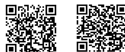
宿舍相關辦法及費用 QR-Code