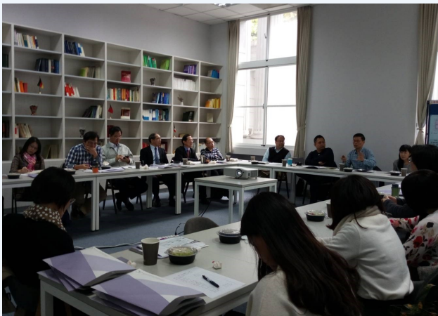
★參與者包含人文學院、公共事務學院、電機資訊學院、法學院、商學院、師培中心等眾多教師。