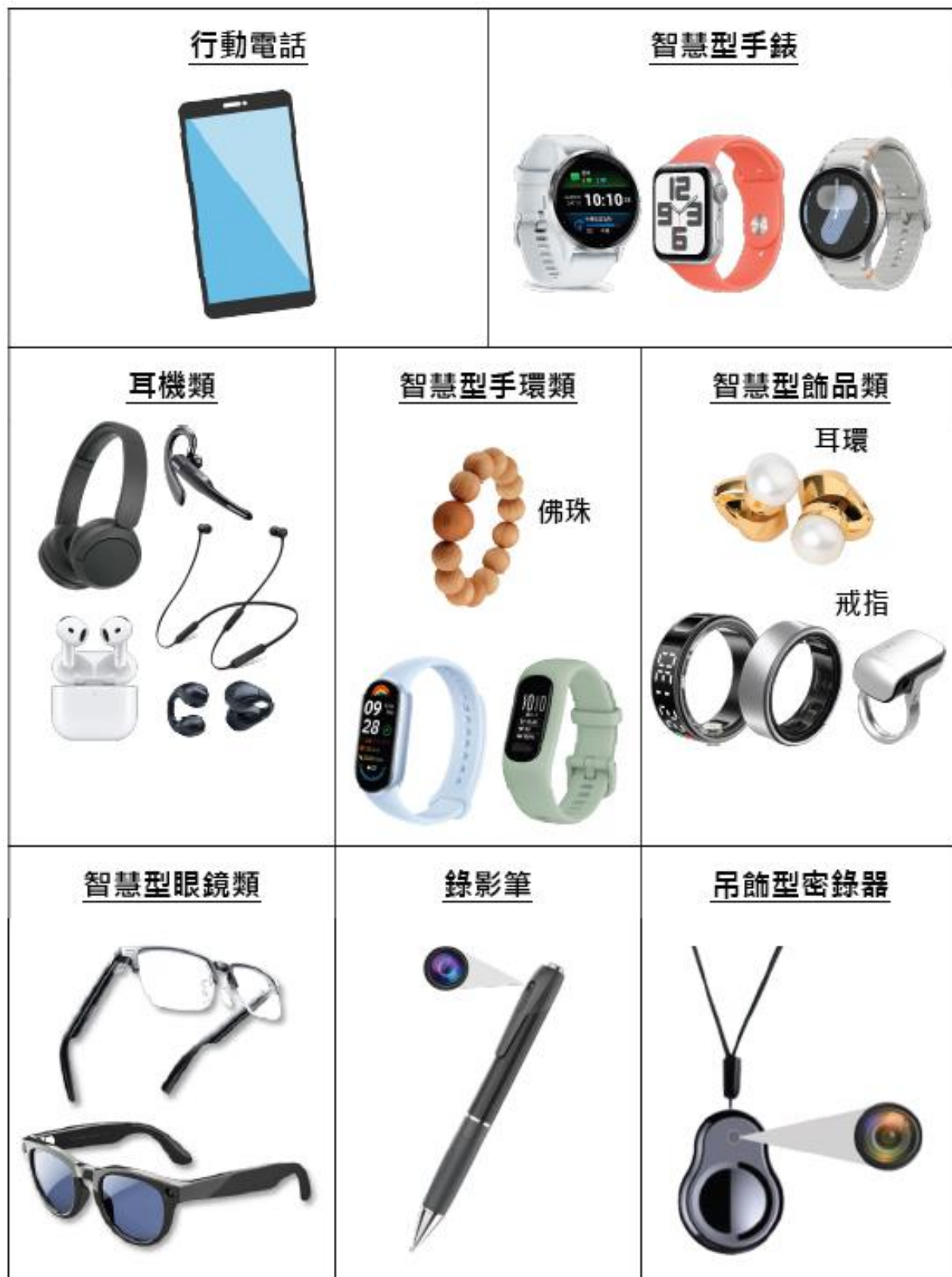
附表九、禁止攜帶穿戴式裝置