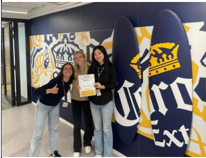
簡述: 實習結束紀念合照