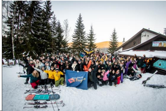
簡述: 參與國際學生會舉辦之滑雪旅行