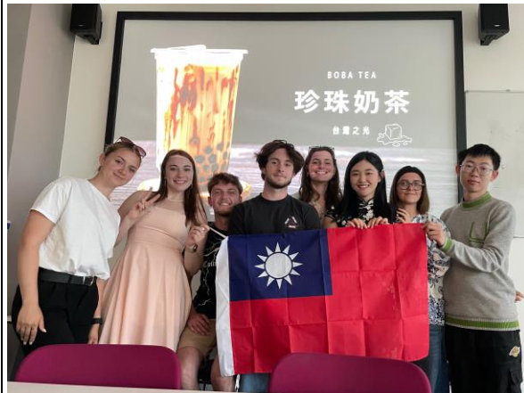
簡述: 國際學生會舉辦的 International Dinner