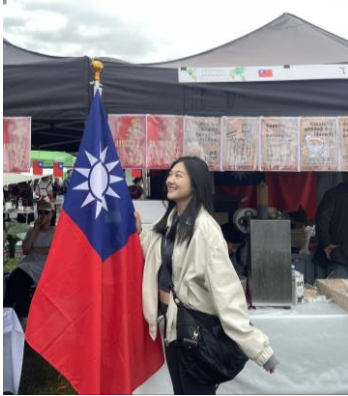
簡述: 抓緊各種活動機會推廣台灣文化