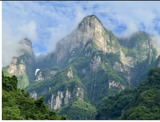
簡述:張家界天門山