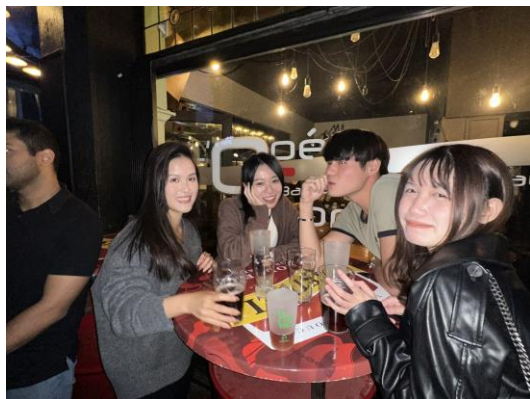
簡述:教授在下課後會揪同學們一起去酒吧喝一杯聊聊天，非常可愛哈哈哈哈哈