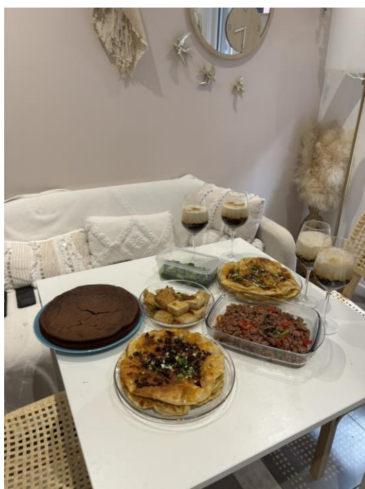
簡述:假日有空時同學們會在一起煮飯，一人負責煮一道自己拿手的料理，我當時負責的是珍珠奶茶!(台灣之光~~)