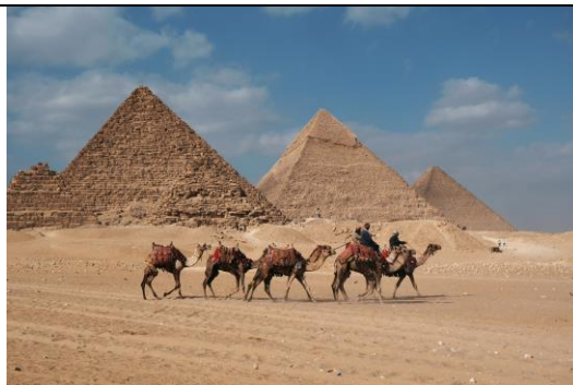
簡述:在這一年之間還跟朋友到了埃及看金字塔，真的超級漂亮!