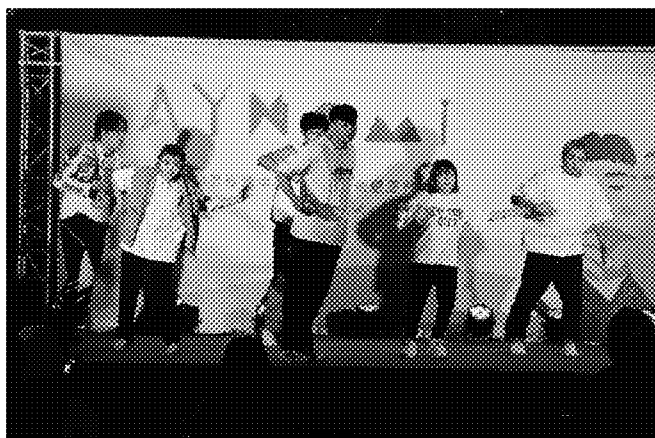
【動態展-各校演出展現】