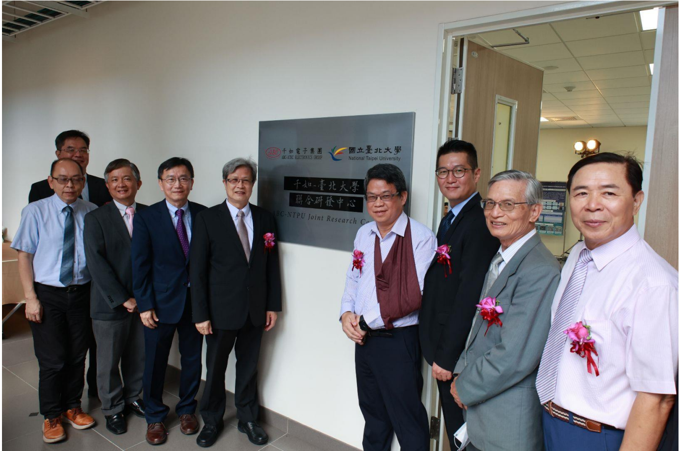
聯合研發中心揭牌