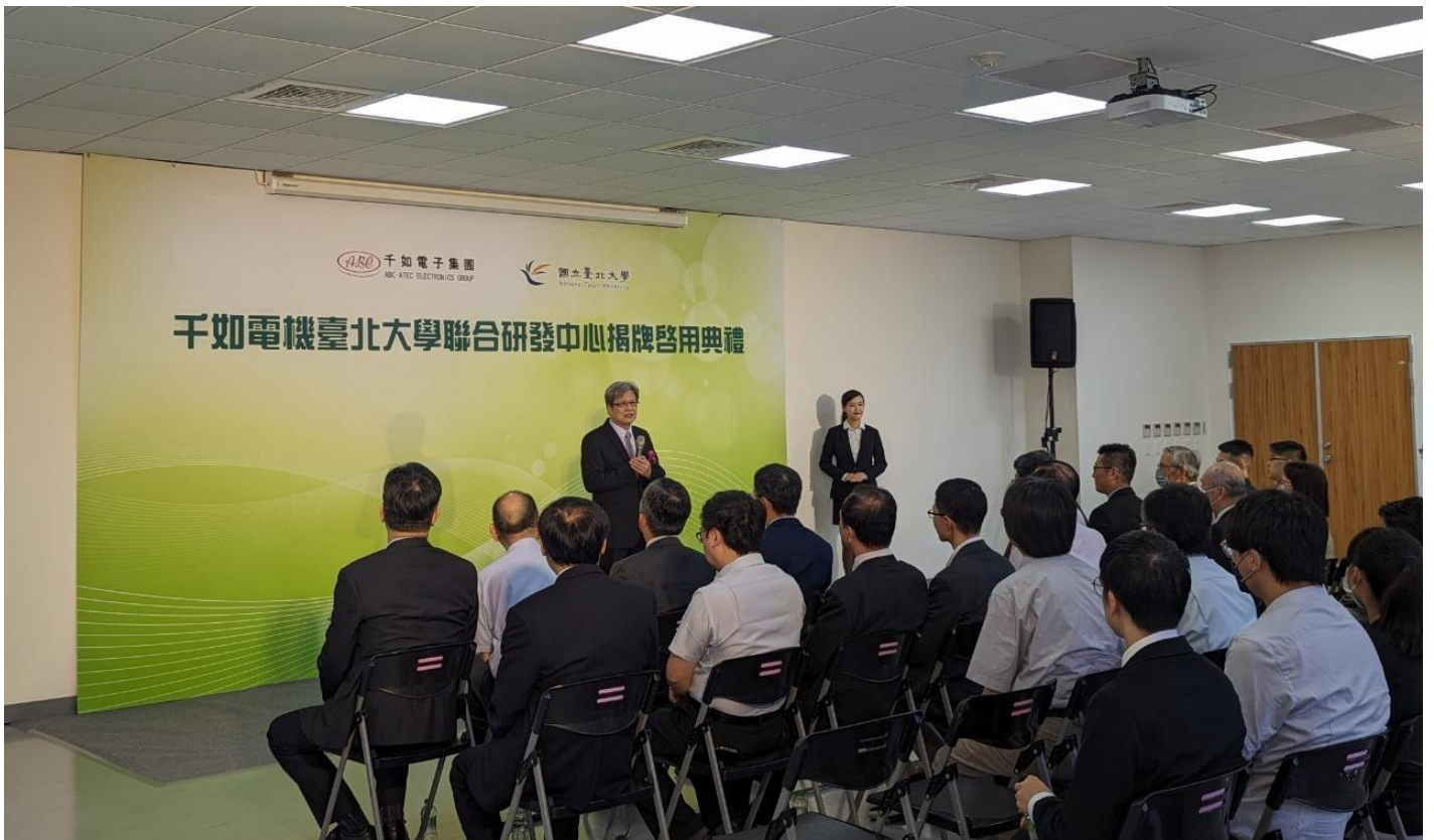
臺北大學李承嘉校長