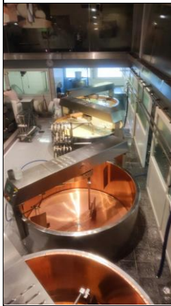
簡述: 參觀起司工廠