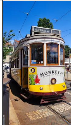
簡述: 葡萄牙里斯本的古早電車