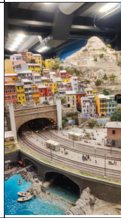
簡述: 位於德國漢堡的迷你模型展