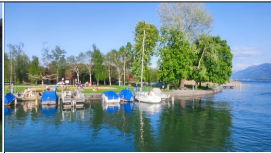
簡述: 瑞士某處的湖岸