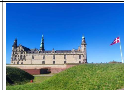
簡述: 哈姆雷特以此為原型的城堡