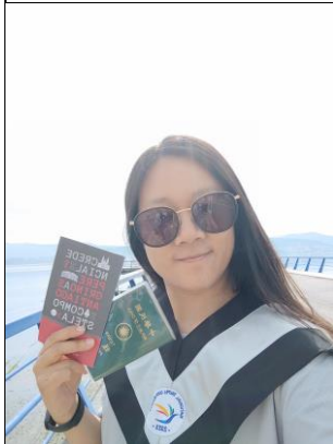
簡述: 回國前至葡萄牙與西班牙走朝聖之路