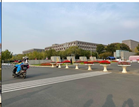
簡述:南京大學仙林校區南門