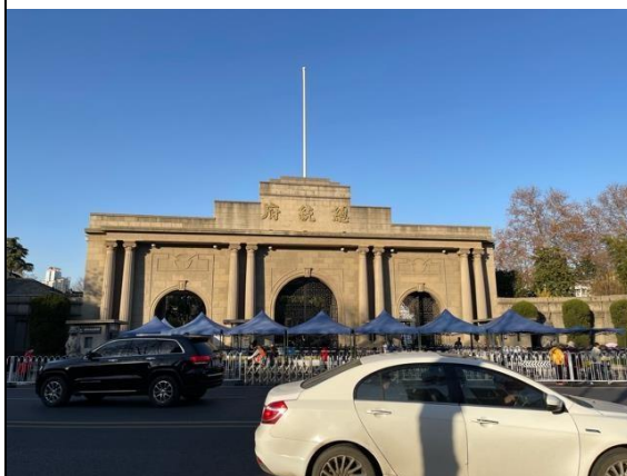
簡述:中華民國總統府舊址