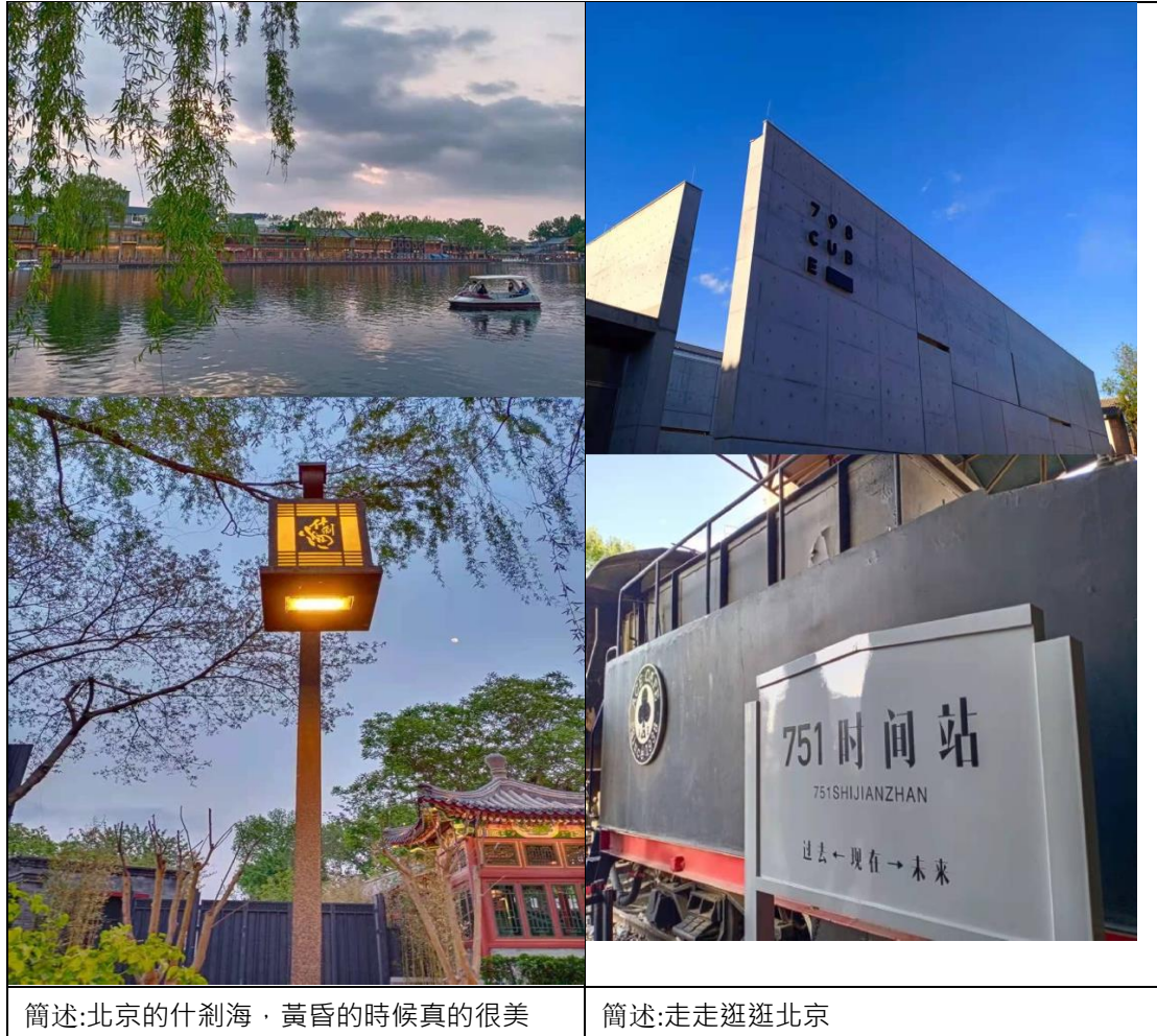
簡述:北京的什刹海·黃昏的時候真的很美