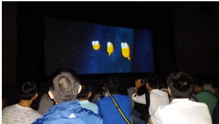
圖 7 梅操電影

每個星期五晚上六點半梅操都會播放露天電影，多半都是當紅的院線片。傍晚五點過後，梅操就會陸陸續續湧上許多人，有的學生還會帶上軍訓時的小板凳，沒有板凳的就隨便找個空地坐下來，因為螢幕夠寬大，因此也不用擔心前面的人會擋到你的視線。夜晚，在星星的閃爍下，與上百名學生、校外人士、孩童一起觀賞電影，看到好笑的橋段時，大夥一起開懷大笑，實為一場不錯的體驗。因此，每個星期五，只要天氣允許(雨天就會取消)，我都會去工學部菜市場買點公婆餅、糯米包油條、麻辣燙等食物，一邊觀看電影，一邊享受美味佳餚。值得注意的