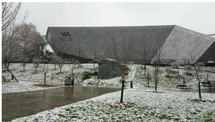
圖 3 武大美術館前雪景

在離開武漢大學前幾天，終於被我盼到武大下雪！據認識的大陸同學提及，武漢下雪可謂可欲不可求，今年運氣好，正好被我碰巧趕上，雖然這場雪只維持短短一天半就全化了，不過還是非常令人興奮的！