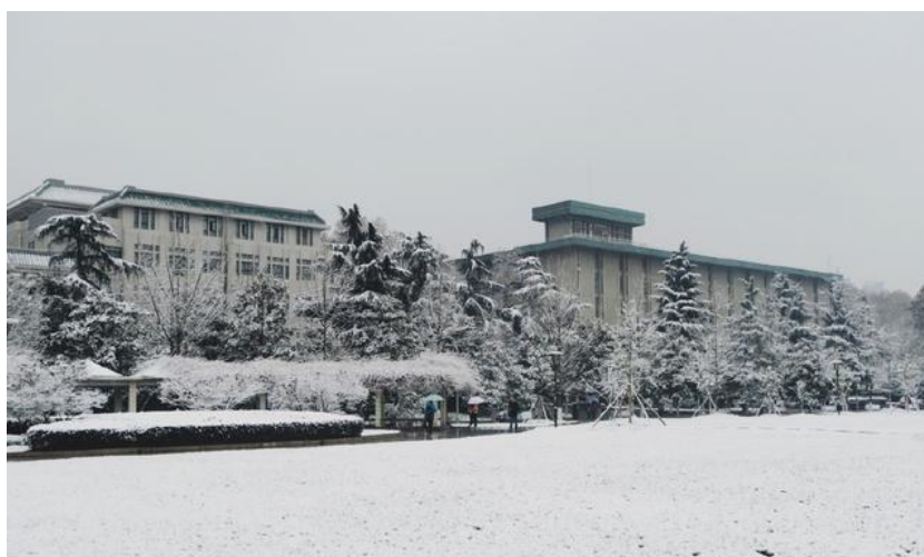
圖 2 武大操場雪景

在武漢大學裡頭，四季分明，八月底初到武大時，正逢高溫氣候，每天都逼近 36、37 度高溫(聽說七八月時破 40 度在所難免)，不用幾分鐘，便會汗如雨下，濕透衣襟。隨著季節的轉變，十月底到十二月初時，校園的銀杏、梧桐、楓葉、香樟等都會慢慢變黃、變紅，將武漢大學染上一層金黃，與春日櫻花節的喧囂熱鬧與人潮洶湧相比，更多的是一種專屬秋季的閒適與愜意。