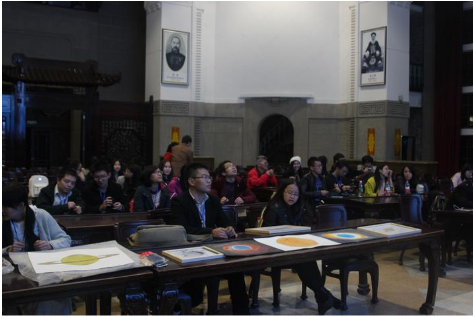
圖 6 在老圖書館裡面，講師與大家闡述現代天文學