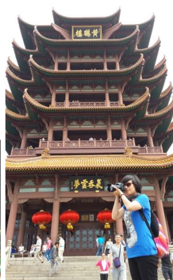
圖 9 黃鶴樓