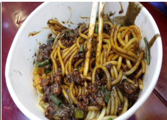
圖 5 蔡林記熱乾麵