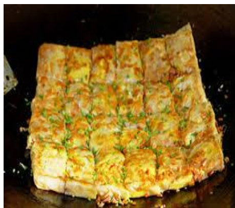
圖 4 三鮮豆皮

武漢注重早點，大都以包子、餃子、麵食類居多，當地人稱吃早點叫做「過早」，最有名的當屬熱乾麵以及豆皮。