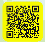
觀音濱海遊憩區位置

A095G0000Q0000000_3801502001_1120004892-ATTACH1.jpg